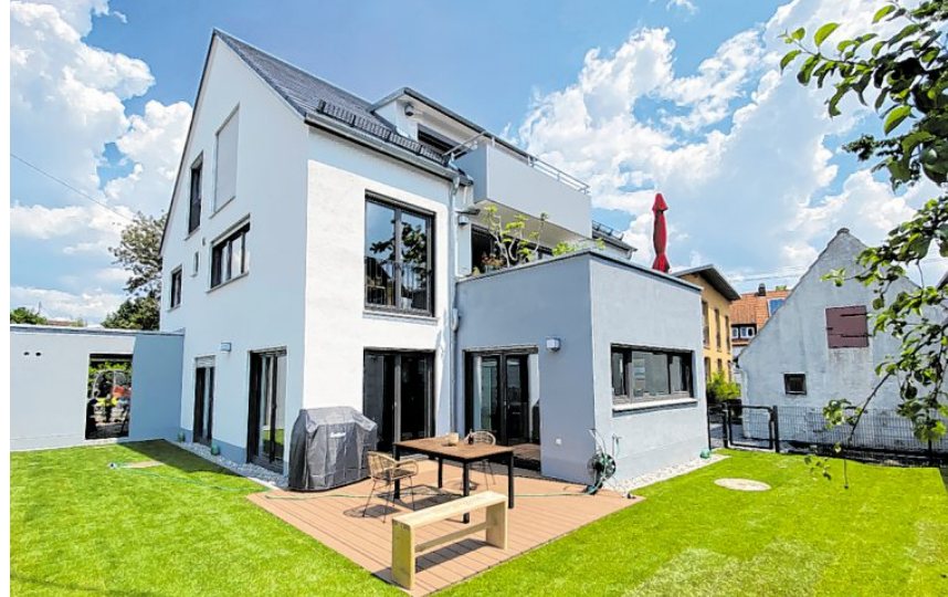
Die Bilder zeigen beispielhaft die Bandbreite an Möglichkeiten, wie die JuWel Wohnbau GmbH Haus- und Wohnräume erfüllt. Mit der Erfahrung von 30 Jahren stehen die Expertinnen und Experten aus Friedberg ihren Auftraggeberinnen und Auftraggebern in allen Projektphasen zur Seite und sorgen für ein Ergebnis, das glücklich macht.